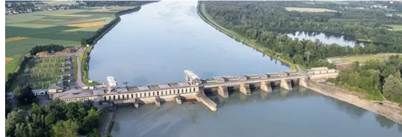
Grüner Strom von Wasserkraftanlagen aus Österreich und Süddeutschland.

Die Quellen unseres Grünstroms werden regelmäßig vom TÜV Süd geprüft und zertifiziert. Das unabhängige Prüfinstitut bestätigt, dass unsere Energie ausschließlich aus erneuerbaren Quellen stammt und den höchsten Nachhaltigkeitsstandards entspricht. Außerdem werden wir von ProEngeno regelmäßig vom TÜV Nord überprüft und zertifiziert.