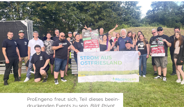
ProEngeno freut sich, Teil dieses beeindruckenden Events zu sein.