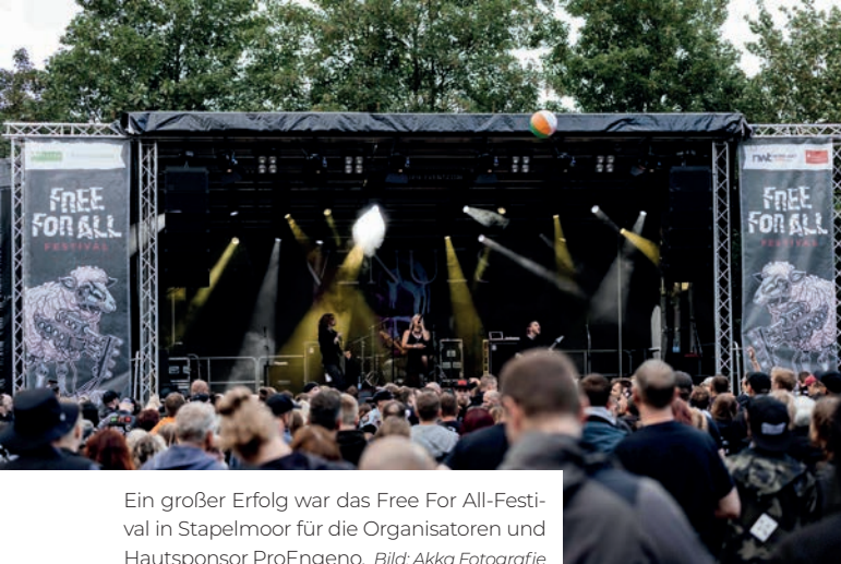
Ein großer Erfolg war das Free For All-Festival in Stapelmoor für die Organisatoren und Hautsponsor ProEngeno.

Free For All e.V. / Hafestraße 6A, 26789 Leer ProEngeno GmbH & Co.KG Nendorper Straße 15 28644 Jemgum