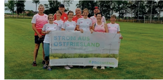
ProEngeno unterstützt den Lauftreff des SV Ems Jemgum.

ProEngeno ist stolz auf die starke Leistung der Laufgruppe und freut sich, dass durch ihre sportliche Aktivität