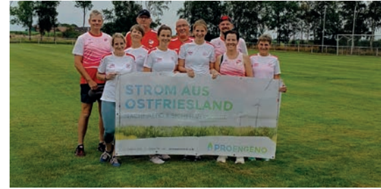
ProEngeno unterstützt den Lauftreff des SV Ems Jemgum.

ProEngeno ist stolz auf die starke Leistung der Laufgruppe und freut sich, dass durch ihre sportliche Aktivität